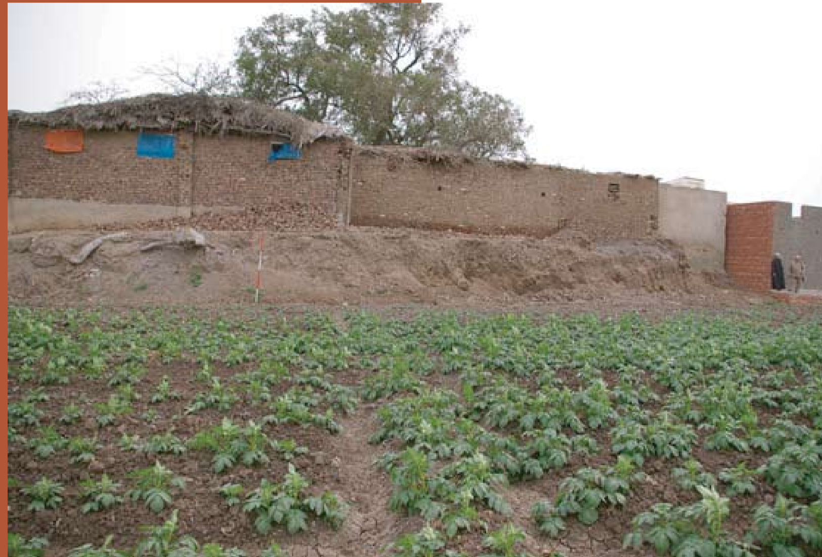
Sheikh Shaheen farmhouse (north) and its pottery