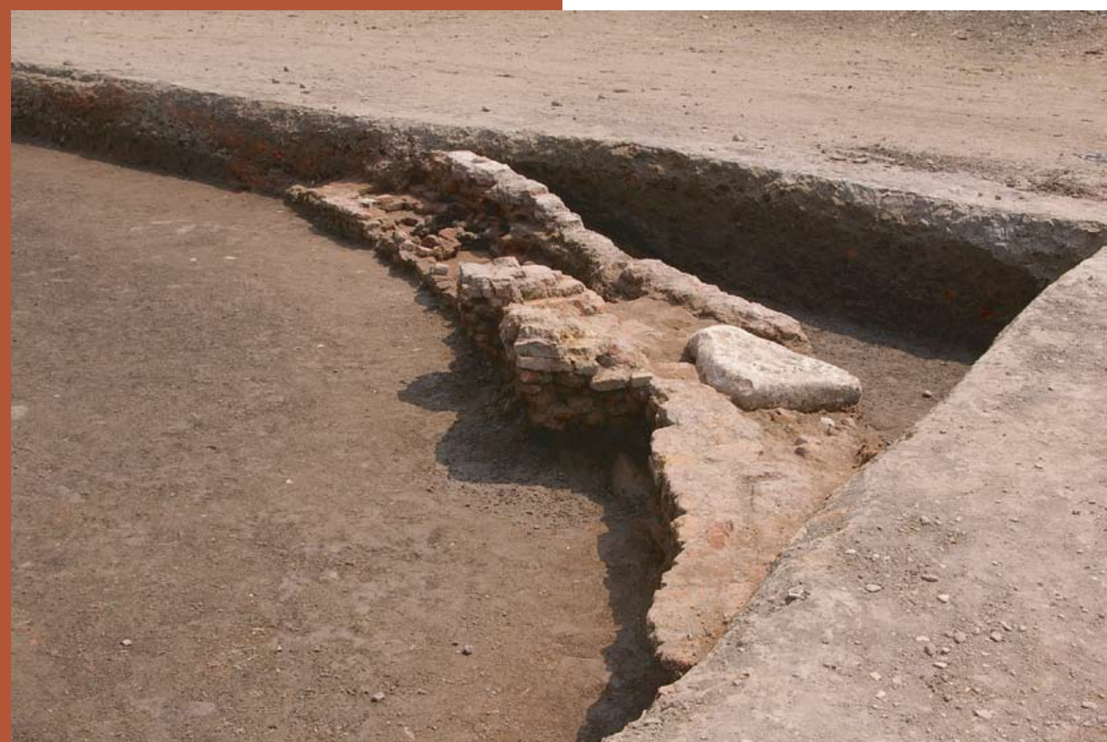
Part of a Church building east of the Great Pit.