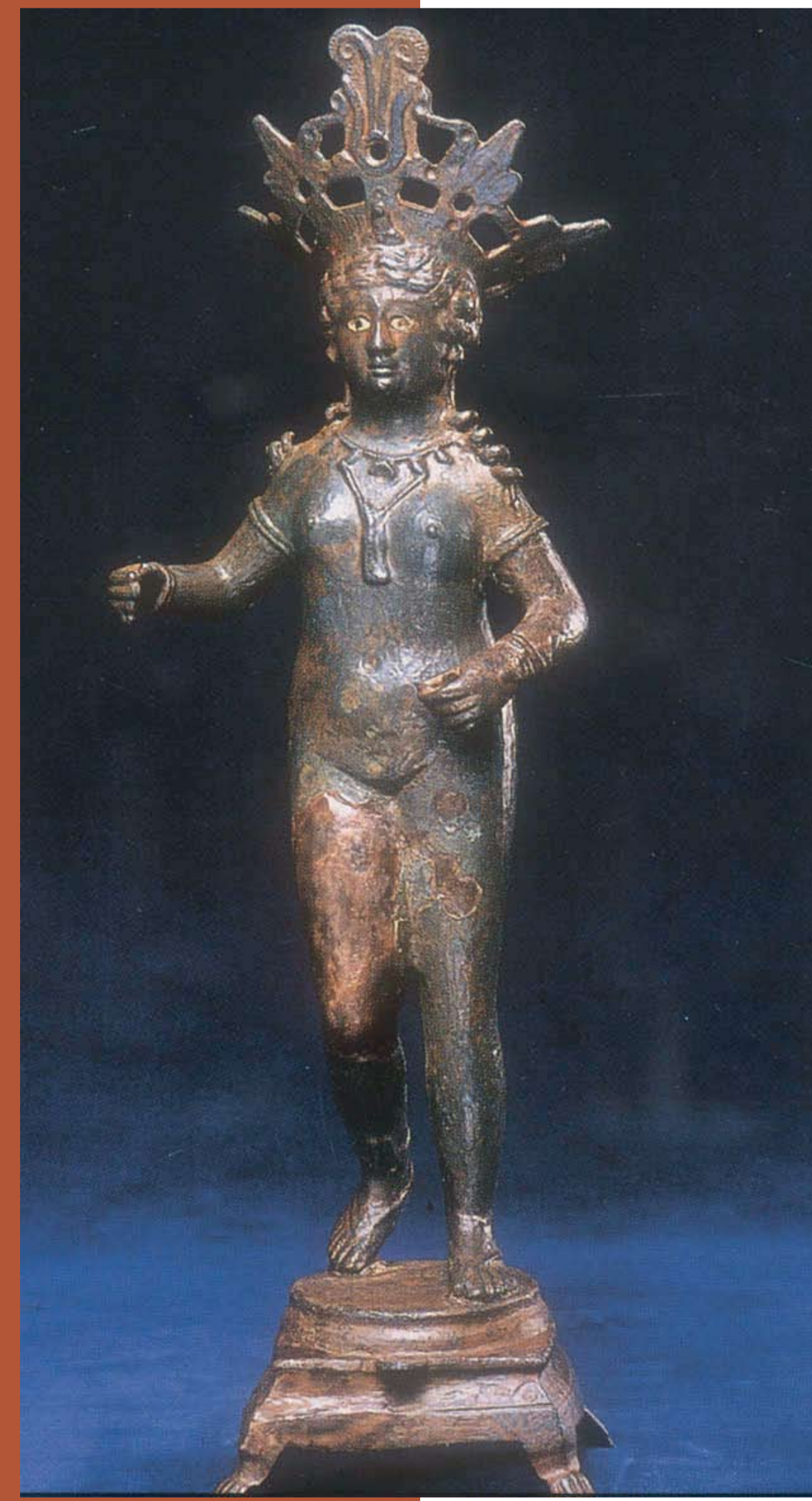
Aphrodite from the Sa el-Hagar hoard

The geographer Al Maqrizi, ca. 1440, tells of a traveller who found a mud brick in the ruins of Sais. When he broke it open he found that it contained an ear of corn in perfect condition, as if it had just been harvested.