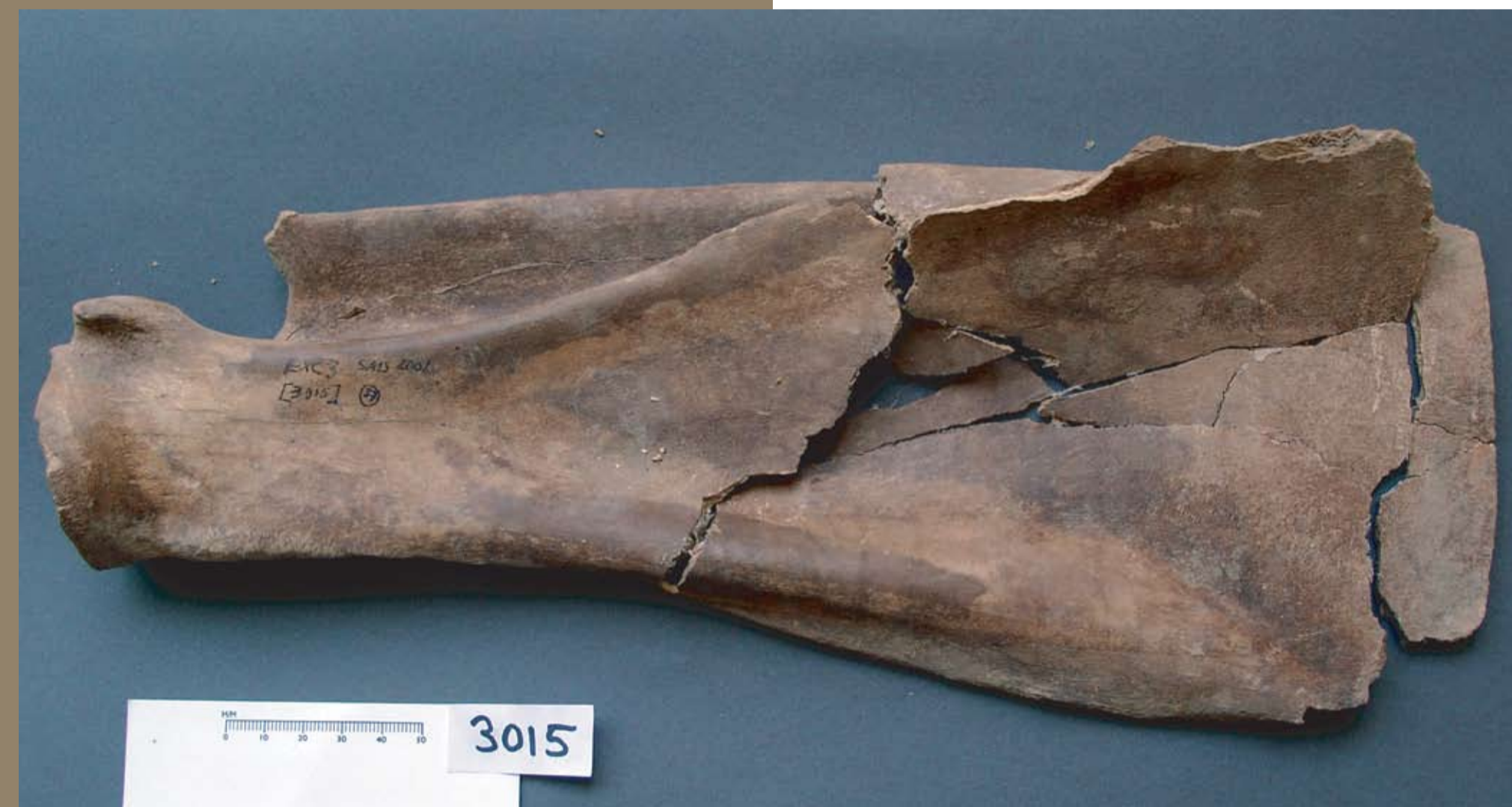
Bull Shoulder blade