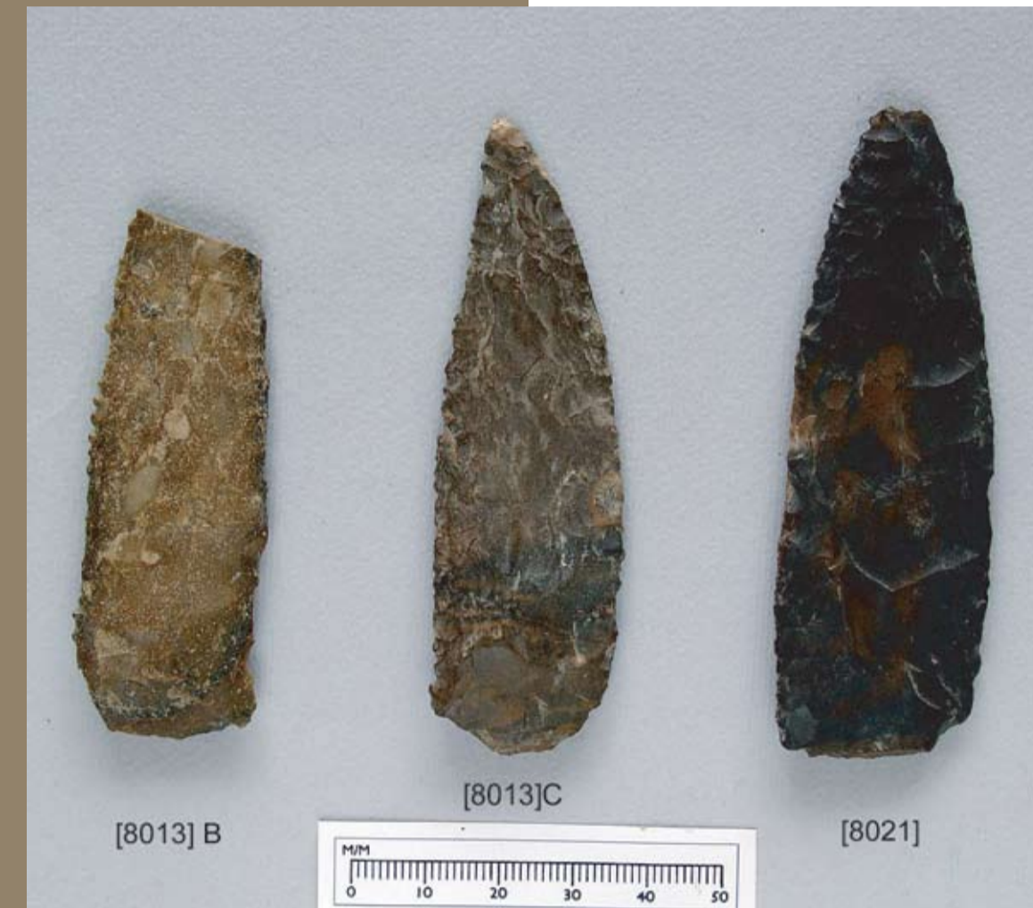
Sickle blades for cutting grain