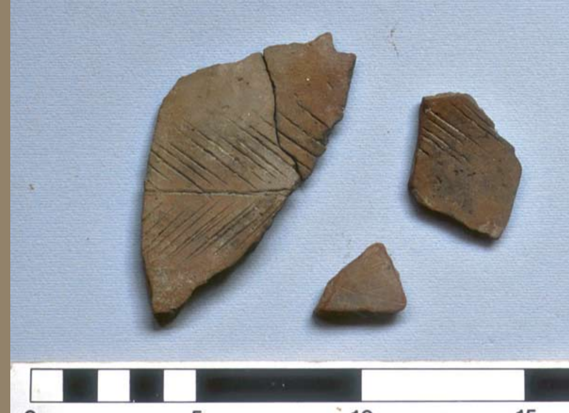
Fish bone patterned pottery