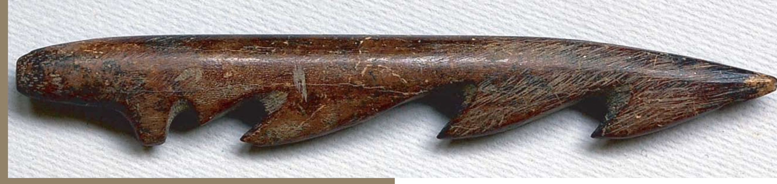
Fishing harpoon, 12 cm long

A fishing community lived on a sand hill or island between two branches of the river then at Sais. They caught catfish and Nile perch which they ate fresh and also processed and kept as dried fish or fish paste. The fish were placed inside red-polished, pottery vessels decorated with fish-bone patterns. The people may have lived originally on the western desert edge and come to Sais in order to take advantage of the fish left lying in the mud pools after the annual inundation.